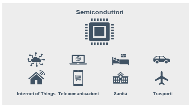
Fig. 1 – Settori fortemente dipendenti dall'offerta di semiconduttori