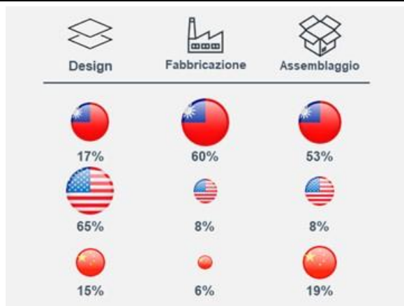
Fig. 2 – Quota di mercato per macro-fase del processo produttivo 6 (%)